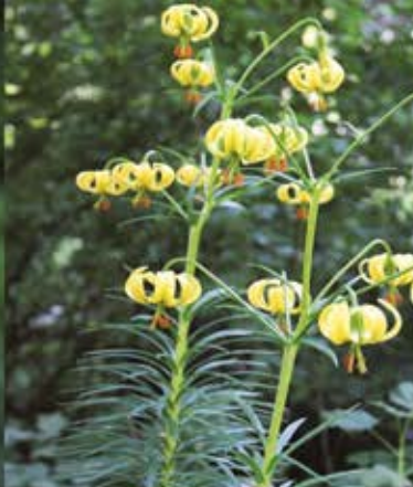
Réalisation FRNC 2018.