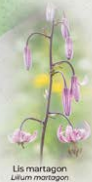
Lis martagon Lilium martagon

3 0h40 - Passerelles Le chemin pénètre un peu plus dans le sous bois avant de longer la rivière. Très vite, nous arrivons à une passerelle qui traverse un premier bras du cours d'eau pour nous emmener sur un îlot. La seconde passerelle nous ramène sur la rive droite du torrent.