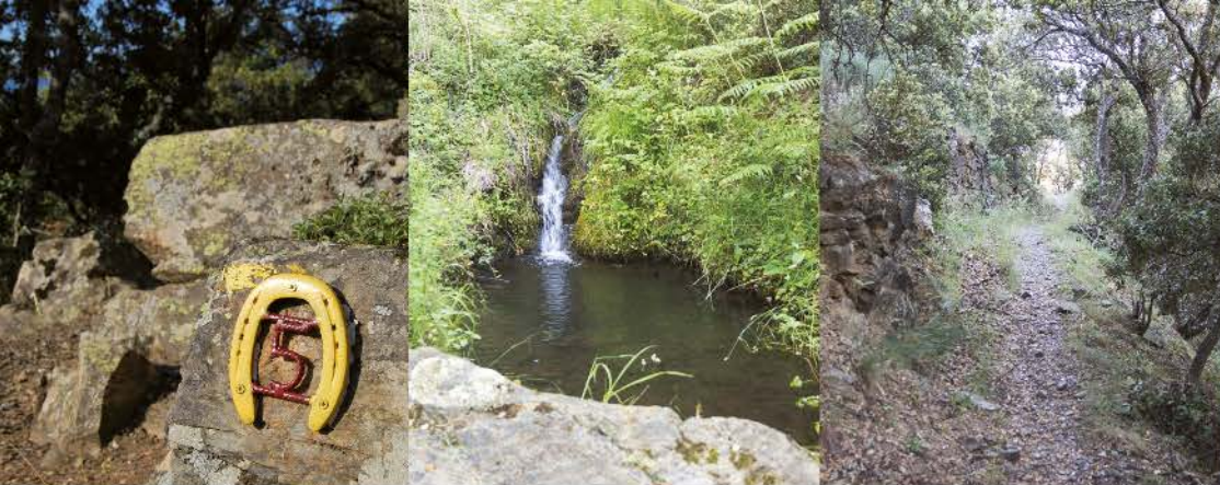
Réalisation FRNC 2018.