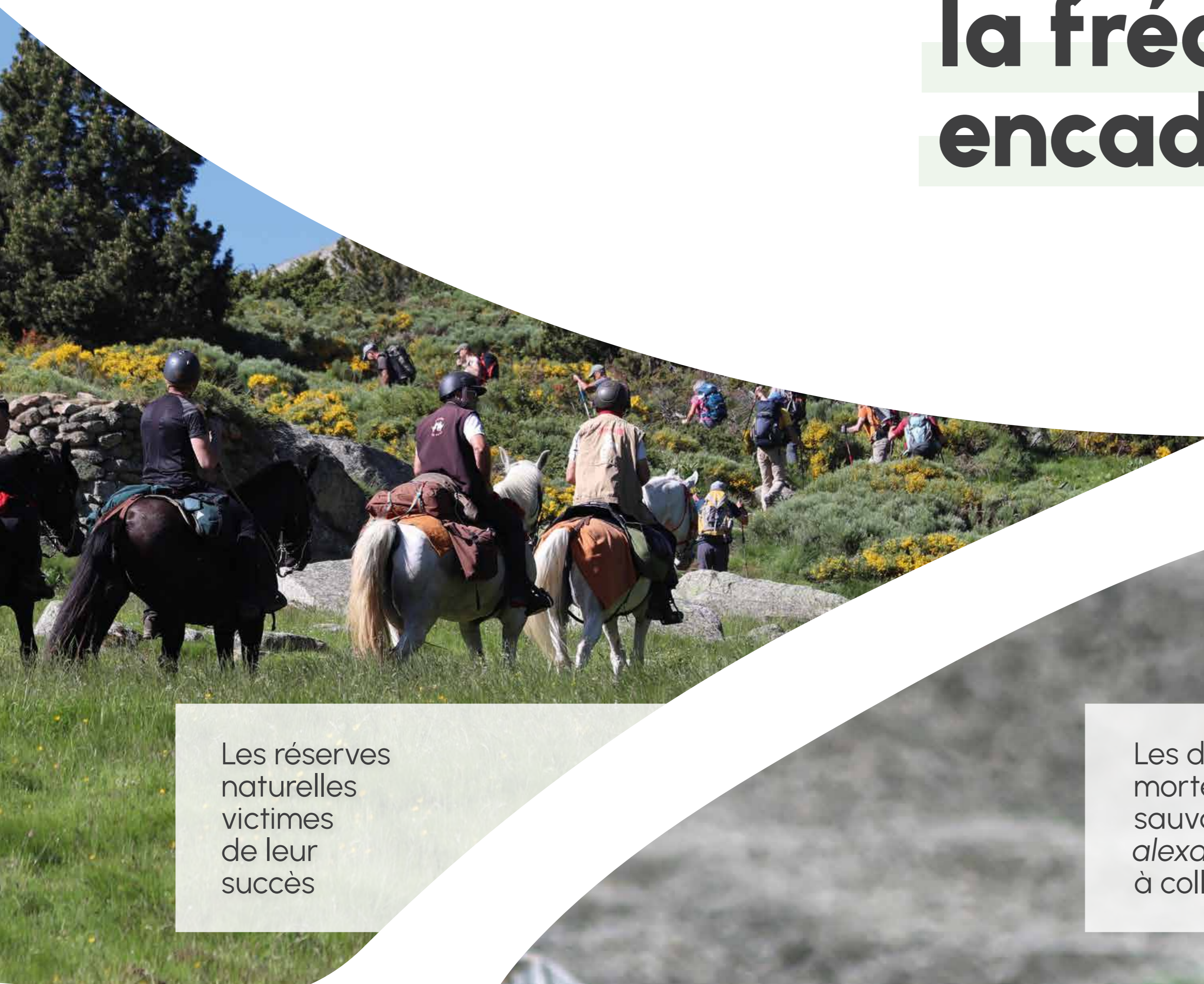
Les réserves naturelles victimes de leur succès

Les réserves naturelles abritent un patrimoine naturel remarquable, protégé par voie réglementaire. Pour cette raison, la fréquentation est strictement encadrée.