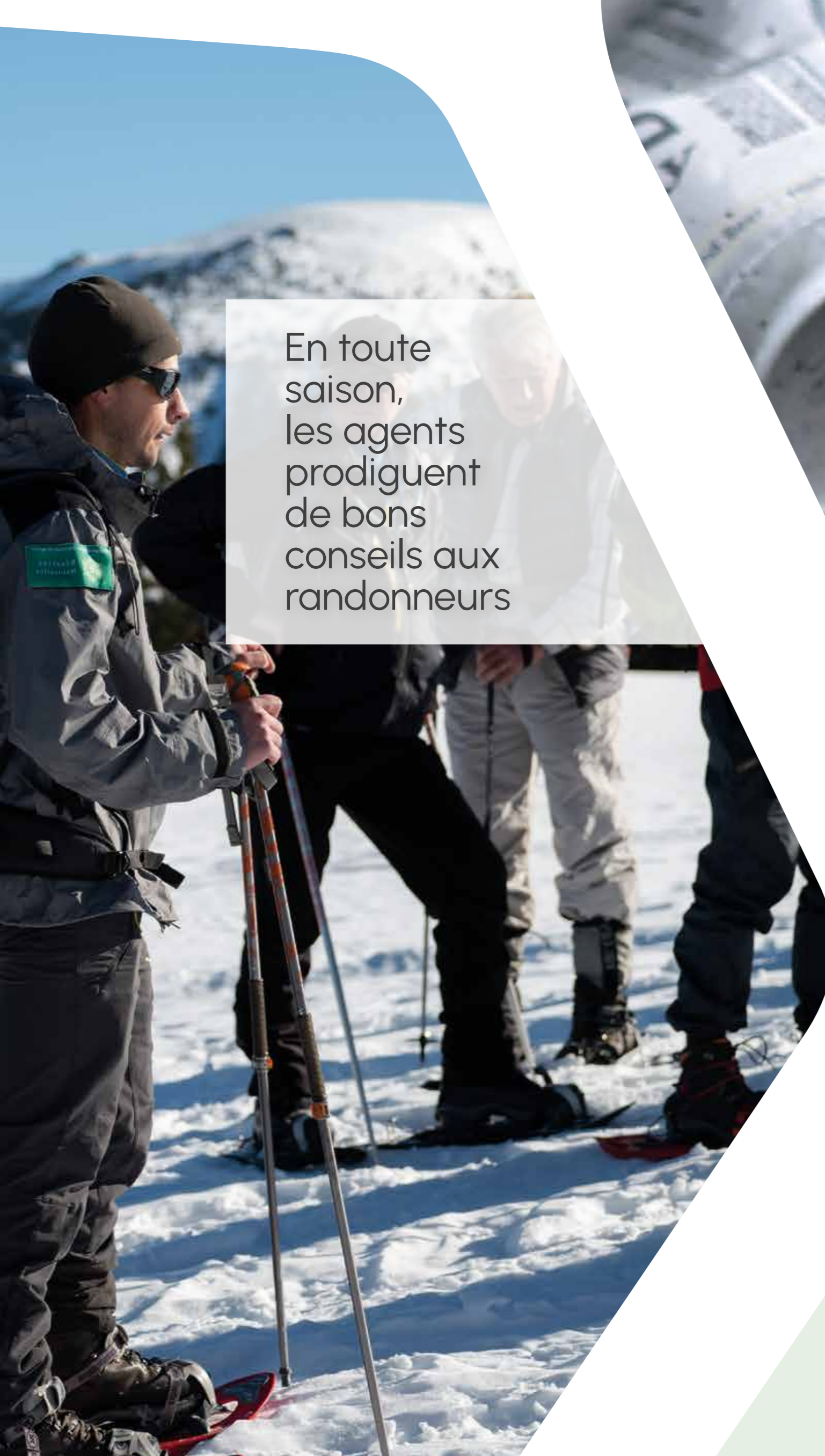
En toute saison, les agents prodiguent de bons conseils aux randonneurs